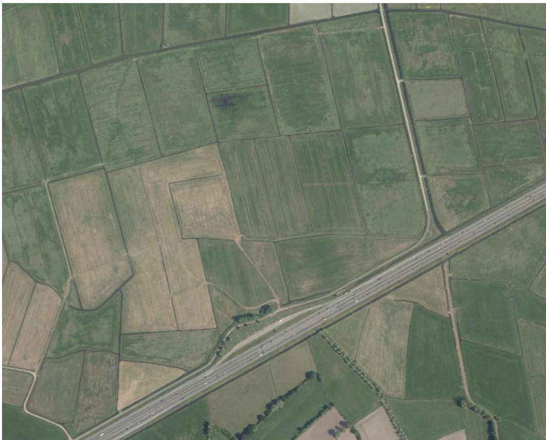
Fig. 2 Een luchtfoto van hetzelfde gebied als in fig. 1 met de A28 er schuin door heen. Voor een betere blik op de kaarten zie https://historieputten.vandekraats.com/ . De oude percelen zijn goed te herkennen. Merk op waar de parkeerplaats is gekomen.