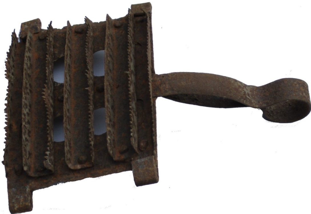
Fig. 1 Een oude roskam zoals bij mij op de boerderij nog aanwezig is.