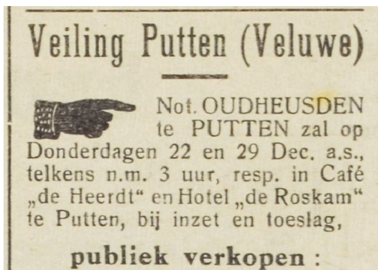
Fig. 4 Een aankondiging uit 1949 waarin de plaatselijke notaris zowel café de Heerdt als hotel de Roskam te vriend lijkt te willen houden.